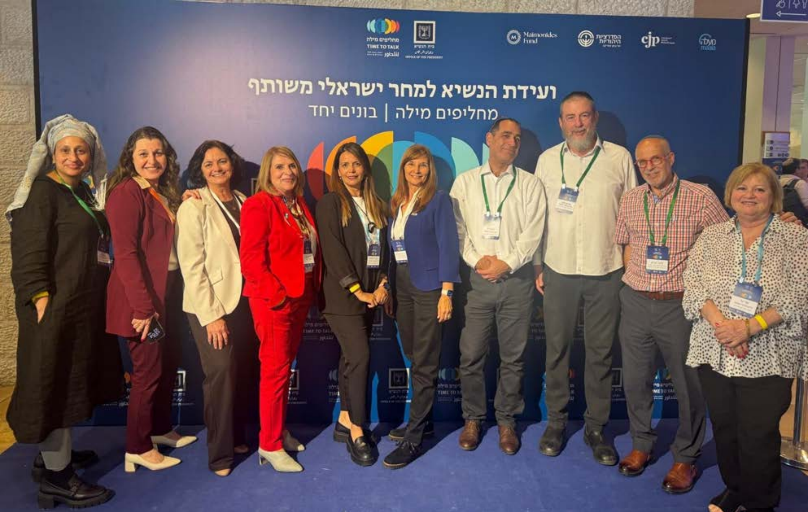
נציגי ארגון מגשרי ישראל בכנס ועידת בית הנשיא למחר ישראלי משותף